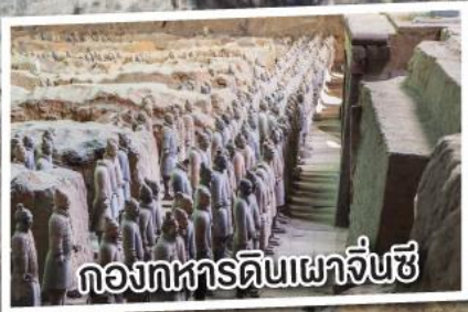
กองทหารดินเผาจีนซี

ประกันสุขภาพและอุบัติเหตุ คุ้มครองสูงสุด 3,000,000 *รวมผู้โดยสารในยานพาหนะของบริษัท