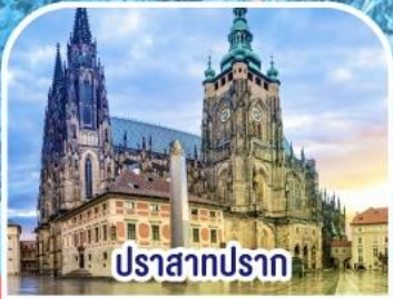
ปราสาทปราก