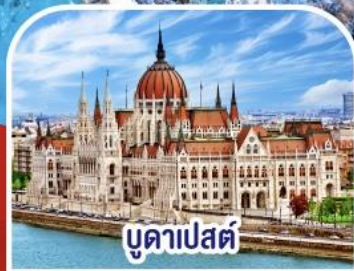
บูดาเปสต์