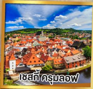
เซสท์ ครุมลอฟ