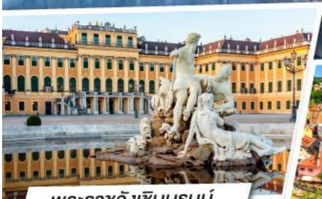
พระราชวังเซินบรุนน์