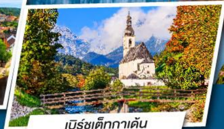
เบิร์ชเต็กกาเดิน