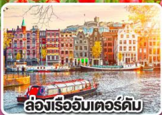
ล่องเรืออัมสเตอร์ดัม