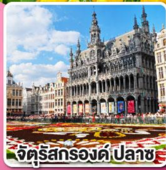
จัตุรัสกรองด์ปลาซ

ล่องเรือหลังคากระจก ชมความสวยงาม ของกรุงอัมสเตอร์ดัม