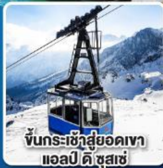
ขึ้นกระเช้าสู่ยอดเขา แอลป์ ดิ ซูสเซ

เที่ยวเมืองอินส์บรุค เพชรเม็ดงามสุดโรแมนติก แห่งแคว้นทิโรล