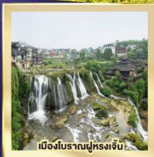
เมืองโบราณฝูหรงเจิน