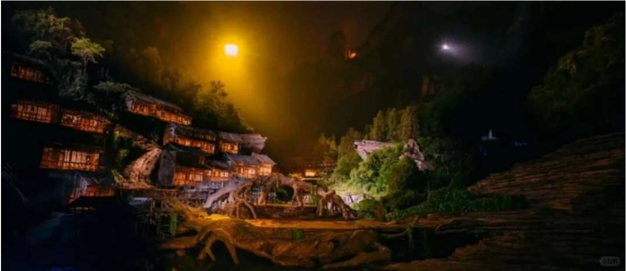
ที่พัก COUNTRY GARDEN PHOENIX HOTELหรือเทียบเท่าระดับ 5 ดาว (มาตรฐานประเทศจีน)

วันที่สาม เขาอวตาร (ลิฟต์แก้วชาจีน) - เขาเทียนจื่อซาน (กระเช้าชาลง) - จุดชมวิวยานเจียเจีย - แกรนด์แคนยอนจางเจียเจีย (VR4D) + สะพานแก้ว - ดิคมหัตถกรรม 72 ชั้น