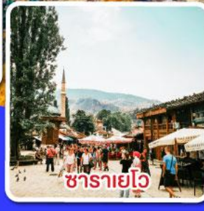
ซาดาร์โย