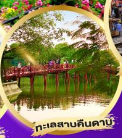
ทะเลสาบคินตาบ