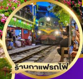
ร้านกาแฟฟัทไฟ