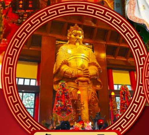
วัดเขangkงหมิว