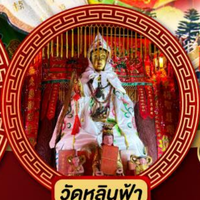
วัดหลินฟ้า