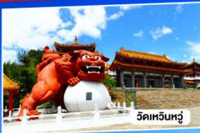
วัดเหวินหลู่

อาลีซาน ทะเลสาบสุริยันจันทรา จั๋วเฟิ่น 5วัน 3คืน