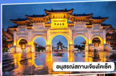
อนุสรณ์สถานเจียงโกเช็ก