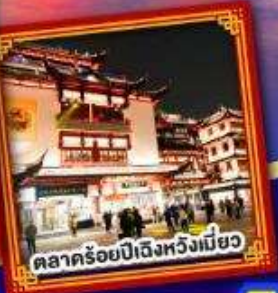
ตลาดร้อยปีเมืองหยิงเมียว