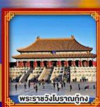
พระราชวังโบราณกุ๊กกิง