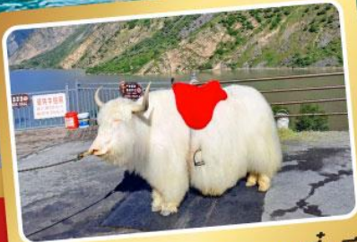
จามริกะเลสาบเตี้ยซี