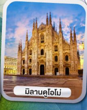
มิลานคูโอโม

✓ ขึ้นกระเช้าหมุน 360 องศา ชมวิวแบบพาโนรามาของยอดเขาทิตลิส