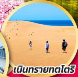
เป็นทรายทตริ

ขอพรเทพเจ้าแห่งความรัก พร้อมชมซากุระ ณ ศาลเจ้าอิซุโมะ โทซะ