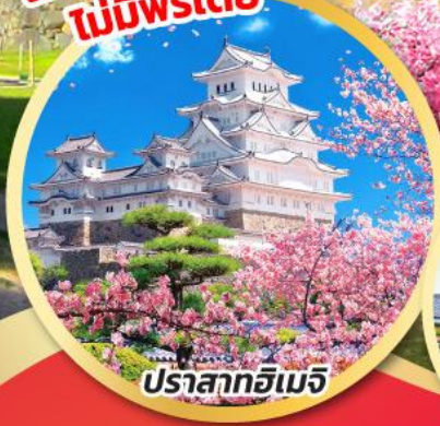
ปราสาทอิมิจิ