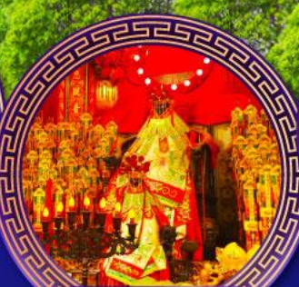
วัดเจ้าแม่กวนอิม ฮ่องกง