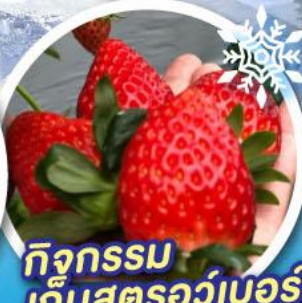
กิจกรรม เก็บสตรอว์เบอร์รี่