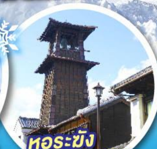
หอรบะซัง โทคิโนะคานะ