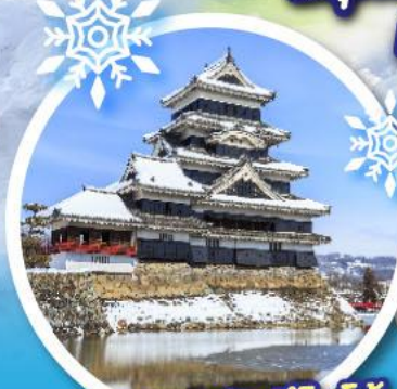
ปราสาทมัสซึโมโตะ

สนุกสนานกับกิจกรรมลานสกี ที่ ikenotaira Ski resort