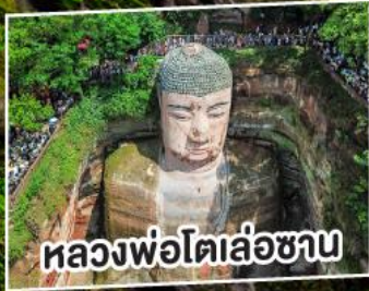
หลวงพ่โตเล่อซาน