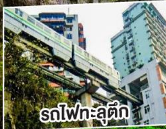
รถไฟทะลุตี๊ก