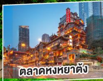
ตลาดหงหยาดัง