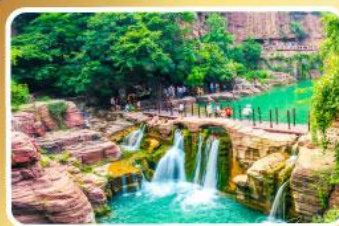
อุทยานหยุ่นโกซาน