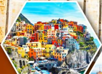
หมู่บ้านมานาโรล่า