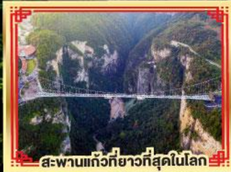
สะพานแกว่งที่ยาวที่สุดในโลก

เขาวังตาร เกียนเหมินซาน สองเมืองโบราณ ฝูหลงเจิ้น เฟิ่งหวง