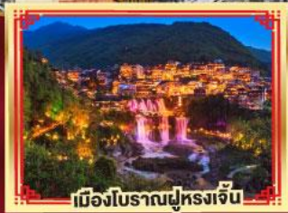
เมืองโบราณฝูหลงเจิ้น