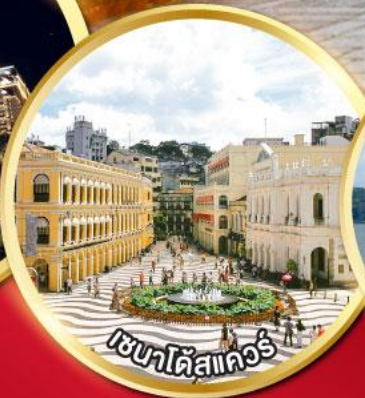
เวเนตียัน