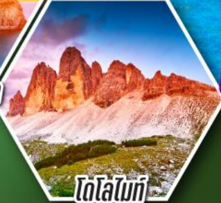
โตโลไมท์

โปรแกรมเดี่ยว เก็บครบจบ อิตาลี ตั้งแต่เหนือถึงใต้