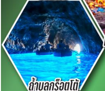
ถ้ำลูกรोटโต้