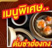
ติ่มซำฮ่องกง