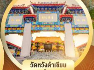
วัดหวังต้าเซียน ขอพรด้านสุขภาพ