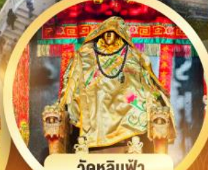
วัดหลิมฟ้า โชคลาภและความมั่งคั่ง