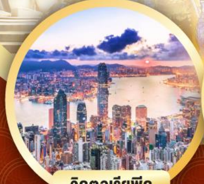
วิกตอเรียพิก