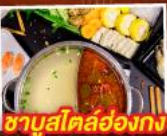
ชาบูสไลด์ฮ่องกง

ช้อปเพลินไม่มีพัก! ตะลุย 3 แหล่งช้อปปิ้งสุดฮิตในฮ่องกงแบบจุใจ... | มงก๊ก จิมซาจุ้ย และซีตี้เกต เอาก์เล็ท