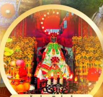
เจ้าแม่กวนอิมฮ่องกง บนี่สารองค์เจ้าแม่กวนอิมที่มีอายุกว่า 600 ปี