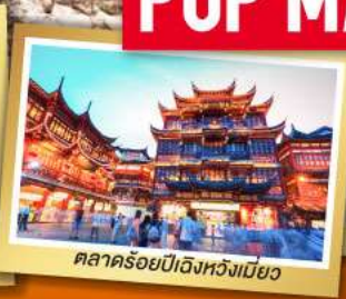
ตลาดร้อยปีเจิ้งหวงเมี่ยว