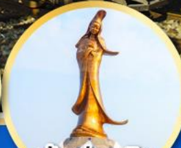
เจ้าแม่กวนอิม ริมทะเลมาเก๊า