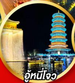
อู๋หนี่โจว