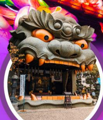
ศาลเจ้านิมมะยาซากะ