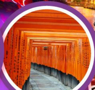
ศาลเจ้าฟูชิมิอินาริ