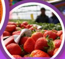
เก็บสตอร์วเบอร์รี่

เดินทาง 04-09, 06-11 ก.พ. 68 14-19, 18-23 ก.พ. 68