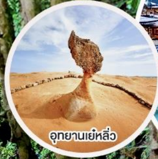
อุทยานเย่หลิว