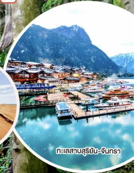
ทะเลสาบสุริยอัน-จันตรา