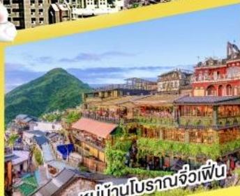
หมู่บ้านโบราณจิวเฟิ่น