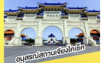
อนุสรณ์สถานเจียงไคเช็ค