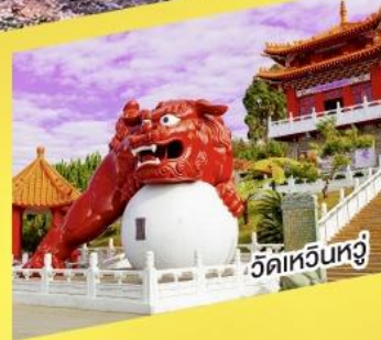
วัดหัวหน่วง