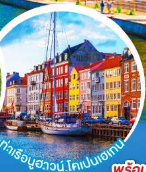
ท่าเรืออ่าววัน.โตปเปเฮเกน

เดินทาง 18-27 มี.ค. 68 10-19, 11-20 เม.ย. 68 02-11, 16-25 พ.ค. 68