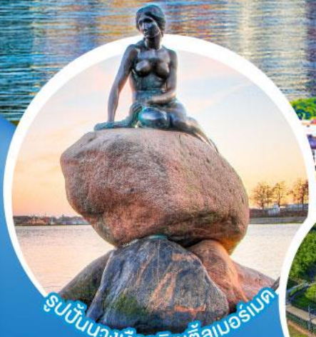
รูปปั้นนางเงือกลิตเติลเมอร์เบด