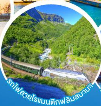
รถไฟสายโรแมนติกฟลัมสบานา