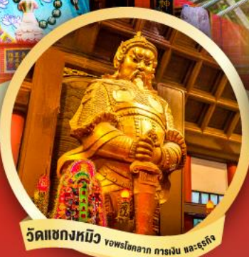
วัดเข่งหมิว ฮ่องกง