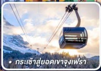
• กระเช้าสู่ยอดเขาจุงเฟรา