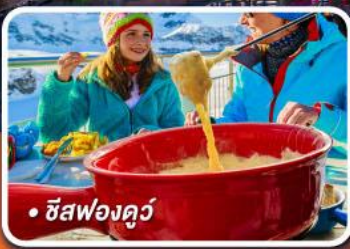
• ชีสฟองดูว์