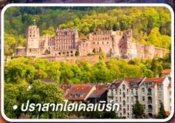
• ปราสาทไคเคิลเบิร์ก