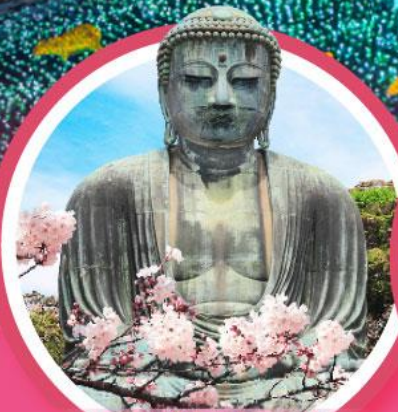
หลวงพ่อดโตบุตสึ