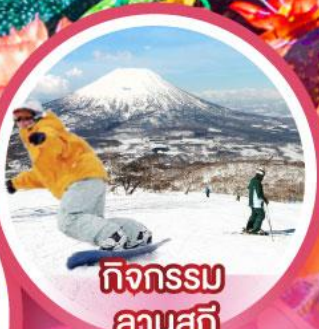
กิจกรรม ลานสกี