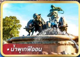
• น้ำพุเทพีออน