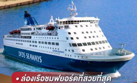
• ล่องเรือชมพยอร์ดที่สวยงามที่สุด