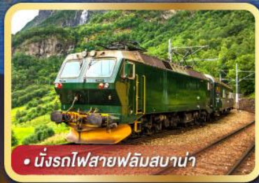
• นั้งรถไฟสายฟลั่มสบาน่า