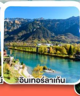
อินเทอร์ลาเก้น