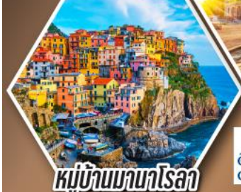
หมู่บ้านมานาโรลา