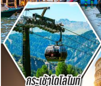
กระเช้าโดโลไมท์