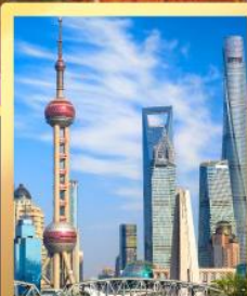
เซี่ยงไฮ้