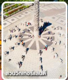
สวนวักเกอร์แลนด์