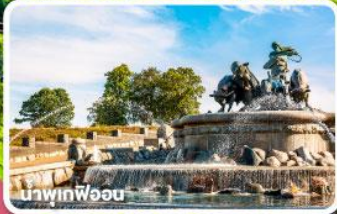
น้ำพุที่ฟืออน