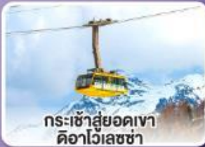
กระเช้าสู่ยอดเขา ดิวาไวเลซซา