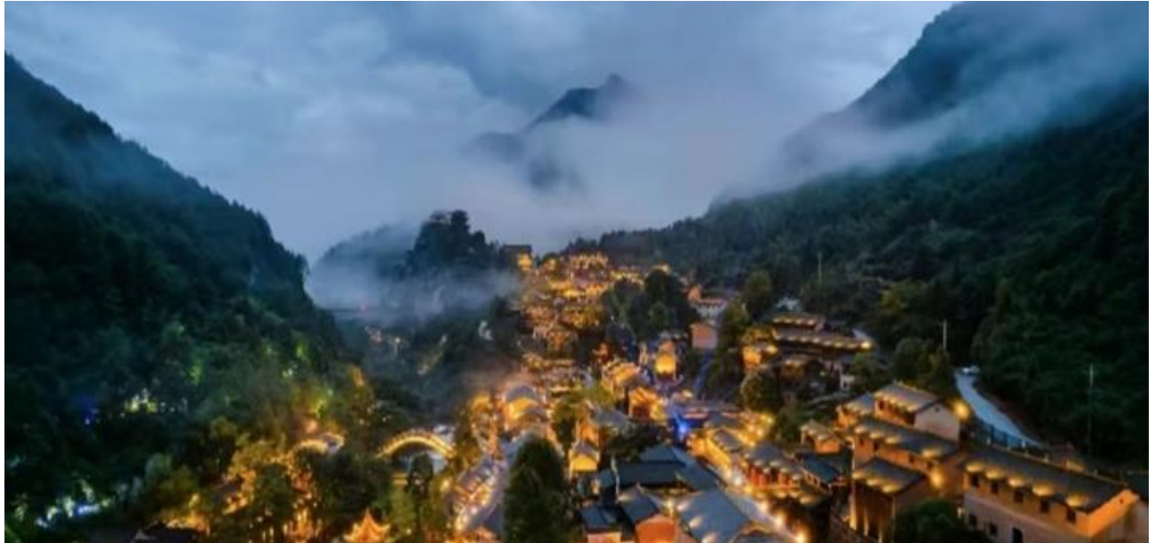
ที่พัก SHANGRAO NEW CENTURY GUANTANG HOTEL หรือเทียบเท่า 5 ดาว (มาตรฐานจีน)