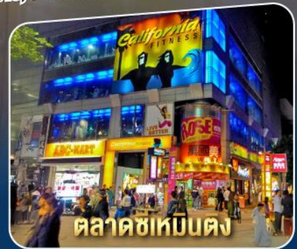
ตลาดซีเหมินตง