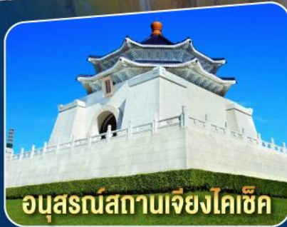
อุทยานสถานเจียงไคเช็ค