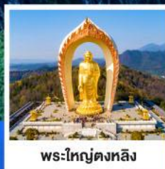
พระใหญ่ตงหลิง