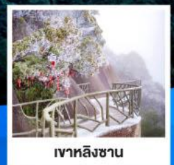
เจาหลิงซาน