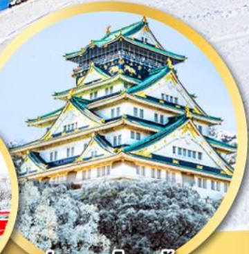
ปราสาทโอซาก้า