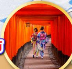
ศาลเจ้าฟูชิมิอินาริ

เที่ยวเต็มทุกวันไม่มีวันฟรีเดย์ บินเข้านาโงย่า-โอซาก้า