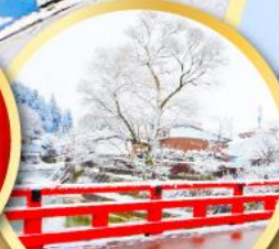
สะพานนากะบาชิ