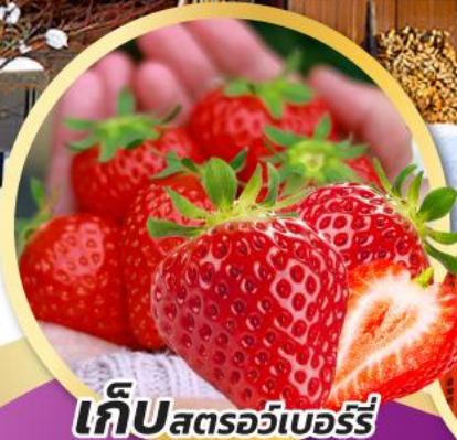
เก็บสตอร์วเบอร์รี่