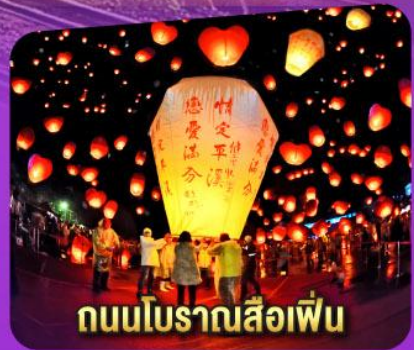
ถนนโบราณสี่งเฟิ่น