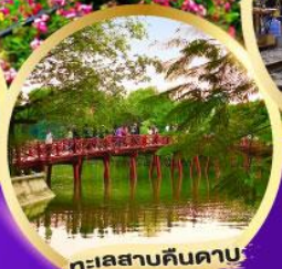
ทะเลสาบคินตาบ