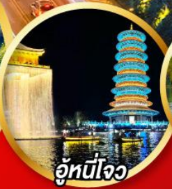
อู๋หนีใจ