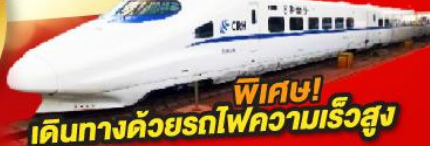
พิเศษ! เดินทางด้วยรถไฟความเร็วสูง