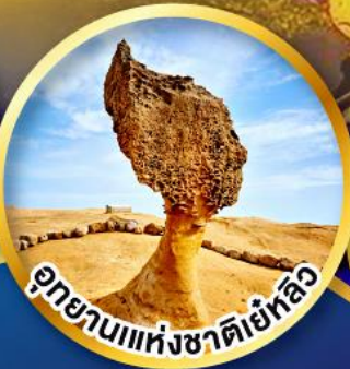
อุทยานแห่งชาติเย้อหลิว