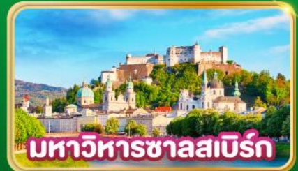
มหาวิหารซาลสเบิร์ก