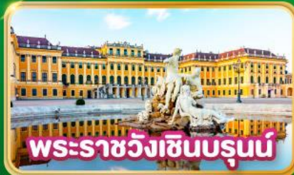
พระราชวังเชินบรุนน์