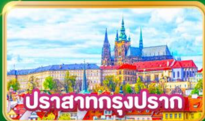
ปราสาทกรุงปราก