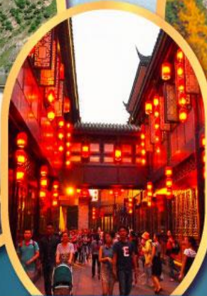
ถนนโบราณจิ้นหลี่