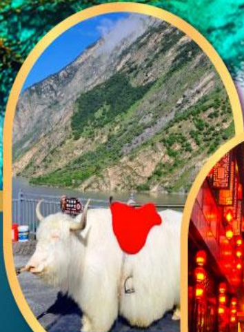
ทะเลสาบเตี้ยซี